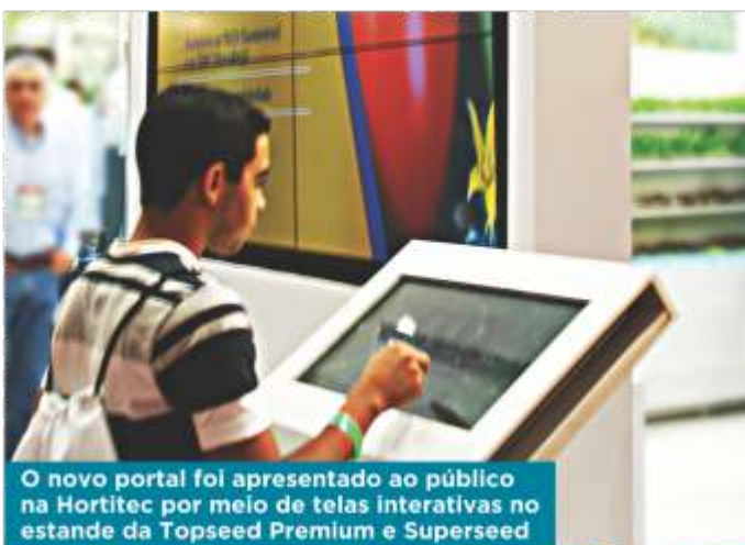
O novo portal foi apresentado ao público na Hortitec por meio de telas interativas no estande da Topseed Premium e Superseed