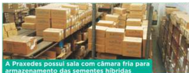
A Praxedes possui sala com câmara fria para armazenamento das sementes híbridas

De acordo com Barreto, em 2015 a empresa vai investir em materiais de divulgação, maior suporte aos lojistas e produtores e na substituição da frota, para aperfeiçoar a logística. ■