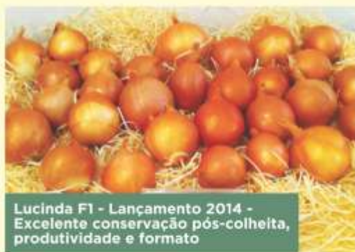
Lucinda F1 - Lançamento 2014 - Excelente conservação pós-colheita, produtividade e formato

híbrido é posicionado para suportar melhor as condições climáticas e atingir excelentes níveis de produtividade, oferecendo ao mercado um produto de excelente qualidade. Hoje, a linha de cebolas híbridas da Topseed Premium conta com 12 materiais comerciais, como o Híbrido Soberana, que se adapta desde o Sul do país até a região Centro-Oeste, com excelente produtividade e elevado rendimento de caixa 3. Na região Nordeste, os híbridos Serena, Fernanda e Predileta, adaptados para as regiões de temperaturas mais elevadas, apresenta altos índices de produtividade e qualidade. Com o material ideal para cada época de semente na região escolhida, o produtor obterá resultados satisfatórios e, consequentemente, redução de custo e melhor aceitação do produto no mercado. Consulte nossos distribuidores e parceiros. De Norte a Sul do país eles estão aptos para ajudar o agricultor no posicionamento de cada um dos híbridos". ■