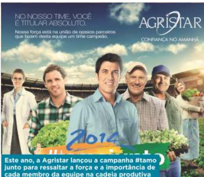
Este ano, a Agristar lançou a campanha #tamo junto para ressaltar a força e a importância de cada membro da equipe na cadeia produtiva

Yellow e Mango Orange), a mini berinjela Milan, o Tomatoberry, os tomates tipo grape nas cores "chocolate", amarelos e laranjas, e as mini abobrinhas verdes e amarelas Ball Squash também chamaram a atenção dos visitantes na Hortitec e tiveram grande repercussão na imprensa.