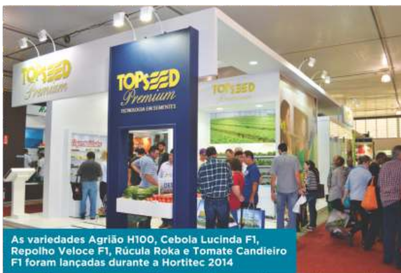
As variedades Agrião H100, Cebola Lucinda F1, Repolho Veloce F1, Rúcula Roka e Tomate Candieiro F1 foram lançadas durante a Hortitec 2014

Novos produtos também foram desenvolvidos este ano. Durante a 21ª edição da Hortitec, a Agristar lançou novas variedades das linhas profissionais, com destaque para o Agrião H100, Cebola Lucinda F1, Repolho Veloce F1, Rúcula Roka e Tomate Candieiro F1 pela Topseed Premium, e o Tomate Ágata pela Superseed. Os produtos da Linha Especialidades, como os mini pimentões coloridos (Apple Red, Honey