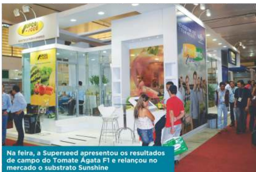
Na feira, a Superseed apresentou os resultados de campo do Tomate Ágata F1 e relançou no mercado o substrato Sunshine