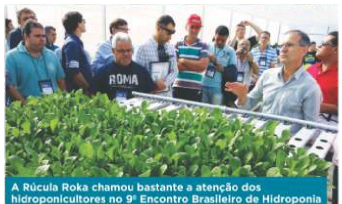
A Rúcula Roka chamou bastante a atenção dos hidroponicultores no 9º Encontro Brasileiro de Hidroponia