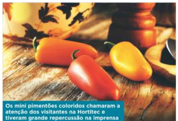
Os mini pimentões coloridos chamaram a atenção dos visitantes na Hortitec e tiveram grande repercussão na imprensa

Para 2015, a Agristar almeja um ano promissor. A empresa buscará um crescimento com qualidade e eficiência de processos, mantendo os investimentos em equipe e equipamentos, além de permanecer focada no desenvolvimento e lançamento de novos materiais e também no suporte técnico e comercial da cadeia. ■