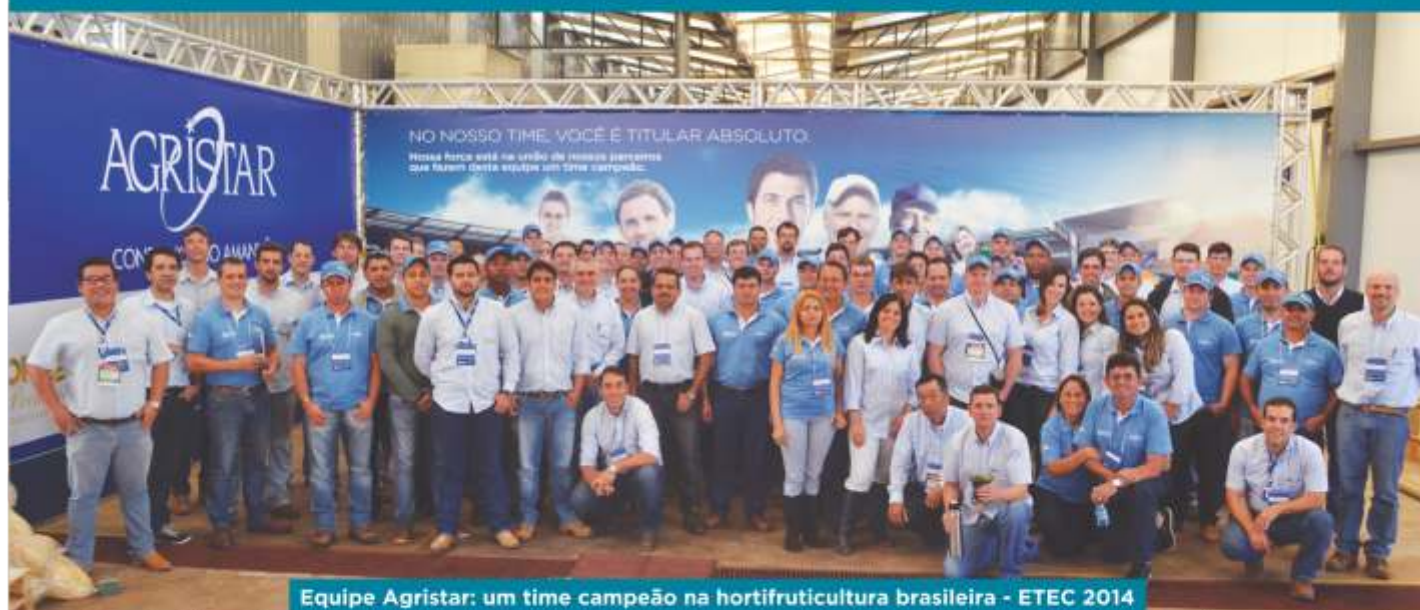
Equipe Agristar: um time campeão na hortifruticultura brasileira - ETEC 2014

2014 foi um ano de grandes conquistas para a Agristar e sua equipe. A missão de levar tecnologia e maior produtividade ao produtor e qualidade e melhores sabores ao consumidor final foi cumprida.