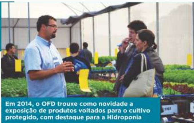
Em 2014, o OFD trouxe como novidade a exposição de produtos voltados para o cultivo protegido, com destaque para a Hidroponia